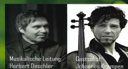
Musikalische Leitung: Herbert Deschler

23. November 2019 19:30 Uhr Dorfgemeinschaftshaus Boos